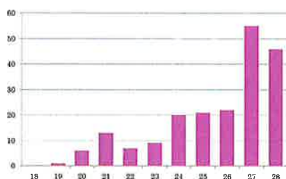
図2 膝関節周辺骨切り術手術件数