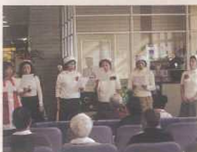
メヌエットのみなさんたち

去る平成19年12月25日(火)14時より6人のボランティア演奏楽団“メヌエット”によるクリスマスコンサートが外来薬局前のフロアにて開催されました。(当院ボランティア委員会並びに患者サービス向上委員会主催)