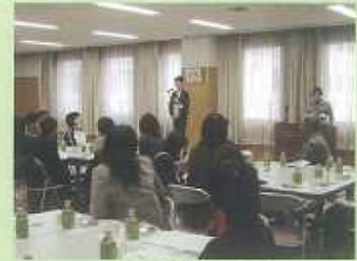
堺総看護師長挨拶

参加して頂いた方からは、『これまでこのような情報交換を行う場所が無かったので機会を頂いて有り難かった。』『また次も行なって欲しい』『他の医療機関の方とも接することができて良かった』など今後に繋がる言葉も頂き好評のなか終わることが出来ました。